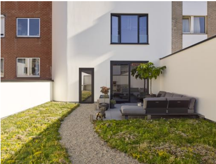
Afbeelding illustratief: groendak met sedums. Foto van een eerdere realisatie van Albat.

Het dak op de eerste verdieping wordt afgewerkt met een extensief groendak. Op deze wijze wordt het regenwater tijdelijk gebufferd na een hevige bui en wordt er een extra thermische isolatie bekomen. Bovendien komt dit de esthetiek ten goede. De substraatlaag van het groendak wordt afgestemd op de toekomstige begroeiing met verschillende sedumsoorten.